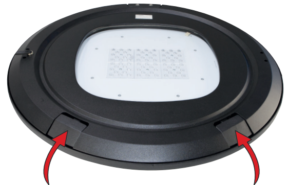
Abb. 2: FUNGO-HQ Verriegelung der Abdeckung lösen