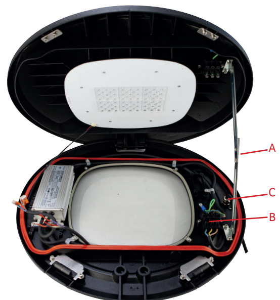
Abb. 3: Das geöffnete Gehäuse