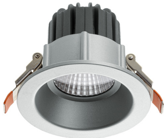
Abb. 1: LED Downlight DOT-100

Technische Änderungen sind vorbehalten. Vergewissern Sie sich, dass Sie immer den neuesten Stand der Informationen verwenden. Aktuelle Informationen finden Sie unter www.abalight.de .