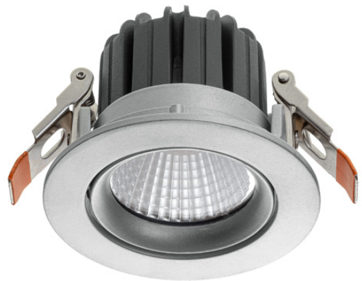
Abb. 1: LED Downlight DOT-90K

Technische Änderungen sind vorbehalten. Vergewissern Sie sich, dass Sie immer den neuesten Stand der Informationen verwenden. Aktuelle Informationen finden Sie unter www.abalight.de .