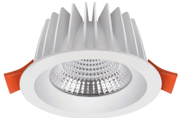
Abb. 1: LED Downlight SMART II

Technische Änderungen sind vorbehalten. Vergewissern Sie sich, dass Sie immer den neuesten Stand der Informationen verwenden. Aktuelle Informationen finden Sie unter www.abalight.de .