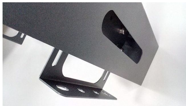
Abb. 4: Für die Befestigung ausgefahrene Montagebügel

abalight GmbH Daruper Str. 2 D-48727 Billerbeck