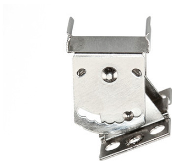
Winkelstück für abgeneigte Montage