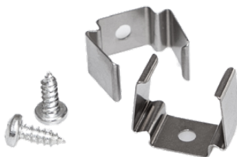
Befestigungsprofil, 2er Set