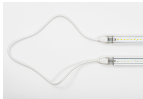
LED Endlostube mit Befestigungsprofil