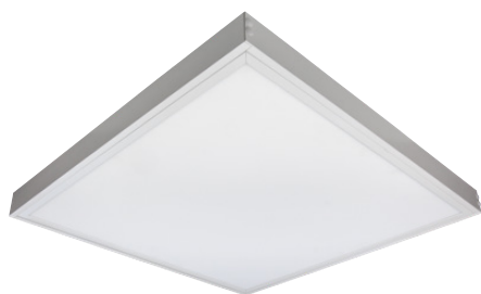
Aufbau-Montagerahmen für LED Panel STEP II, weiß