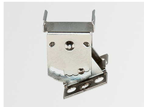
Winkelstück für abgeneigte Montage