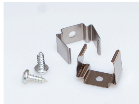
Befestigungsprofil, 2er Set