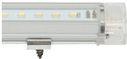
LED Endlostube mit Befestigungsprofil

Andere Lichtfarben oder Längen auf Anfrage.