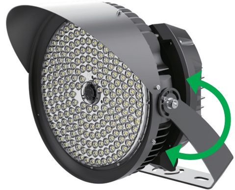
Abb. 3: Am Bügel von 15^{\circ} bis 80^{\circ} schwenkbar

Technische Änderungen sind vorbehalten. Vergewissern Sie sich, dass Sie immer den neuesten Stand der Informationen verwenden. Aktuelle Informationen finden Sie unter www.abalight.de .